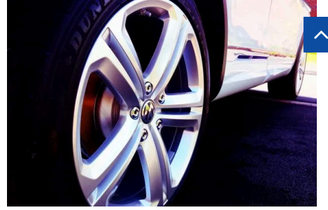
MIMO 2025: INNOVAZIONE E SOSTENIBILITÀ AL MILANO MONZA MOTOR