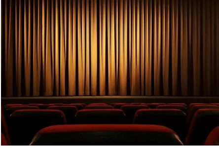
MINIMA THEATRICALIA, IL TEATRO SOCIALE CHE CHIEDE UNA MANO AI...